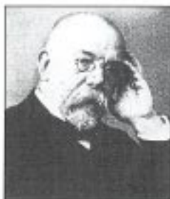
Dr. Robert Koch di sala 1882 de mîkrobên weremê keşfkir.

Mîkroben weremê dikarin j' mirovan vegirê mirovan. Mîrovek kû nexweşîya werema vekirî lê hêyî, dikare gava di axvîtinêde, koxandinêde, binîşkinêde b'nefesa xwe mîkroben weremê vegirê mirovên l'derdora xwe.